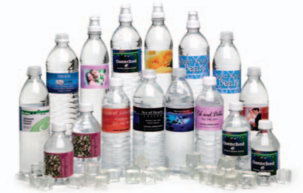
Etiquettes pour bouteille d'eau!

La LX810 imprime sur de nombreux supports différents comme des étiquettes brillantes, mates ou semi brillantes, mais aussi sur des étiquettes en polyester transparent, du synthétique, ou sur tout matériel adhésif et même des étiquettes en haute brillance, qui sont waterproof. Elles sont parfaites pour des boîtes ou des cartons qui peuvent être exposés à l'eau, la pluie ou la neige.