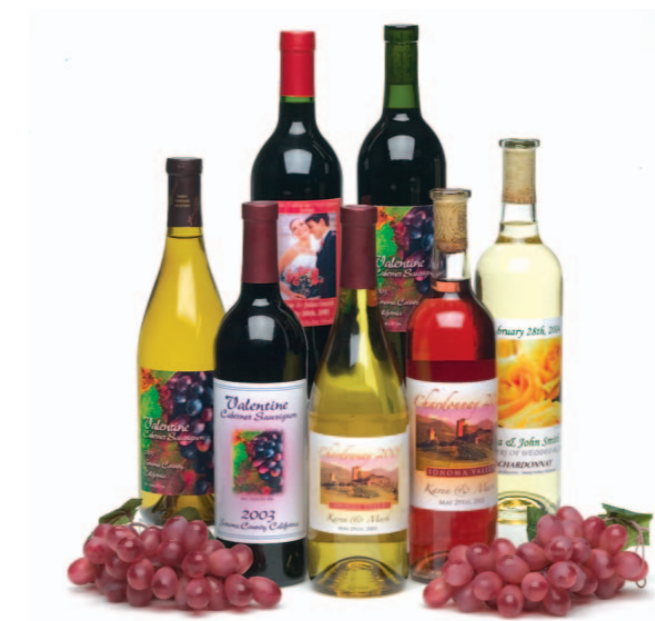
Etiquettes de bouteilles de vin!

La spécialité de la LX810 est de produire des étiquettes de haute qualité pour des besoins immédiats. C'est également l'outil parfait pour échantillonner vos plus grosses productions comme les tests marketing, contrats de production, création d'étiquettes privées ou promotionnelles, emballages en couleur avec le code barres nécessaire. Et bien plus encore!