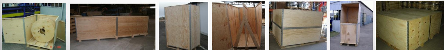
Exemples de caisses Docmatic

Chez Doc Emballages nous savons nous adapter à vos contraintes et vous apporter des solutions performantes dans des délais restreints.