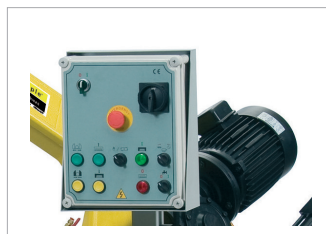
Panneau de commande orientable