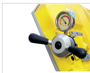
Dispositif de tension du ruban