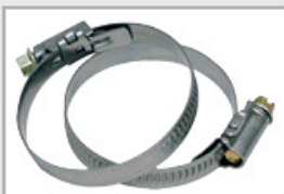
Collier de serrage 386060