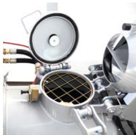
Grille protectrice pivotable