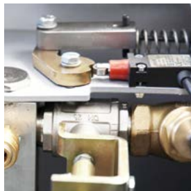
Coupure protectrice du tamis du dôme à l'intérieur