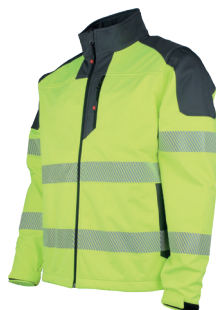
Jaune Fluo/Charcoal 740730HVJ