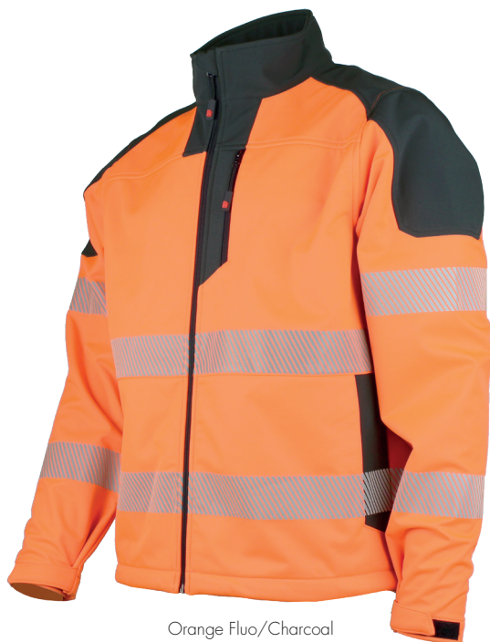
Orange Fluo/Charcoal 740730HVO