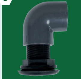
Event de dégazage