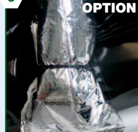
Protection thermique vanne