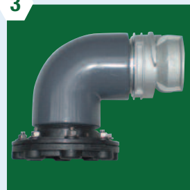
Trop plein DN 80