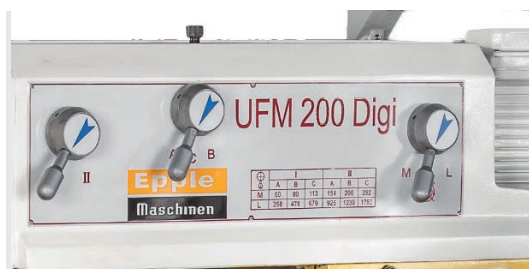
Panneau de commande pour sélectionner les 12 vitesses de rotation