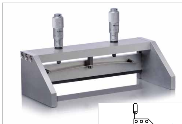
Modèle manuel le plus polyvalent

L'applicateur est constitué de deux plaques d'assise et d'un pont qui est relié à l'arête supérieure de la lame de tirage au moyen de deux micromètres munis de ressorts à lames: l'ajustement de la hauteur de fente est ainsi rendu possible. La lame de tirage et les plaques d'appui sont en aluminium de 6,4 mm. Les plaques d'appui empêchent le produit échantillon de s'écouler sur les côtés pendant le processus d'étalement.