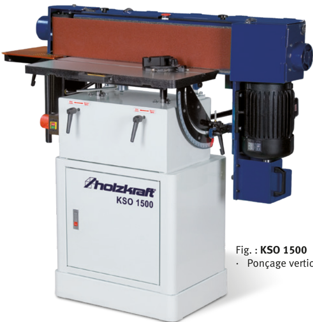
Fig. : KSO 1500 · Ponçage vertical