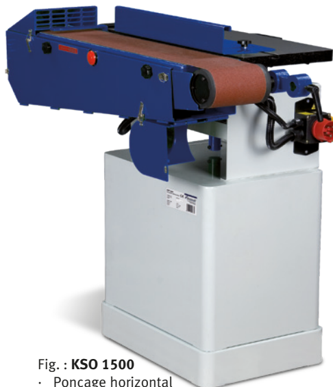
Fig. : KSO 1500 · Ponçage horizontal