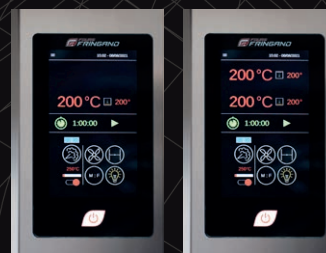
Commande FDC (option)