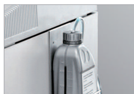
Lubrification automatique du bloc de coupe