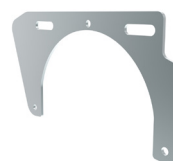
Contrepoids 7 kg (max 20 pcs.) Z162.850