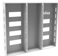
Plaque de montage pour attelage pivotant ZG30.004.700