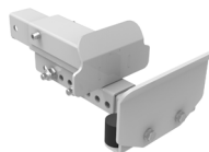
Crochet Roll box (50x50) ZG60.026.700