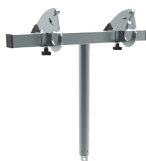
Attelage pacs poubelles A190.720