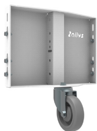
Plaque de montage pour crochets ZG30.003.700