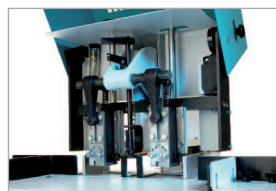
Écartement réglable des têtes d'agrafage