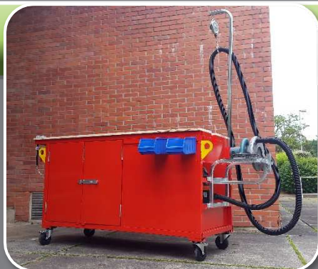
TABLE ASPIRATION GRUTABLE

Etabli de chantier multifonction permettant d'effectuer des travaux de sciage, d'aspirer les poussières et de stocker du matériel sur chantier