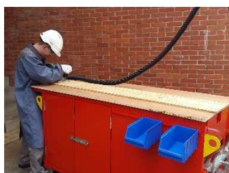
TABLE DE SCIAGE

Plan de travail en bois à évidement central avec serre joints intégrés pour travaux de découpe