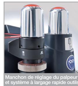
Manchon de réglage du palpeur et système à largage rapide outils

Tiroir à accessoires incorporé grande contenance avec 20 alvéoles pour mettre palpeurs et fraises, plus un vaste espace réservé à d'autres accessoires vous permettront de travailler avec un maximum d'organisation et dans l'ordre. Compartiment à outil de bord très pratique pour y déposer les clés et les accessoires lors du taillage.