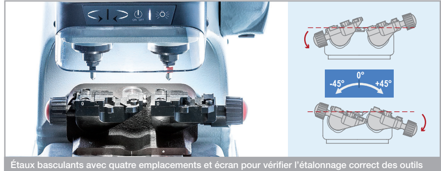
Étaux basculants avec quatre emplacements et écran pour vérifier l'étalonnage correct des outils