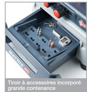
Tiroir à accessoires incorporé grande contenance