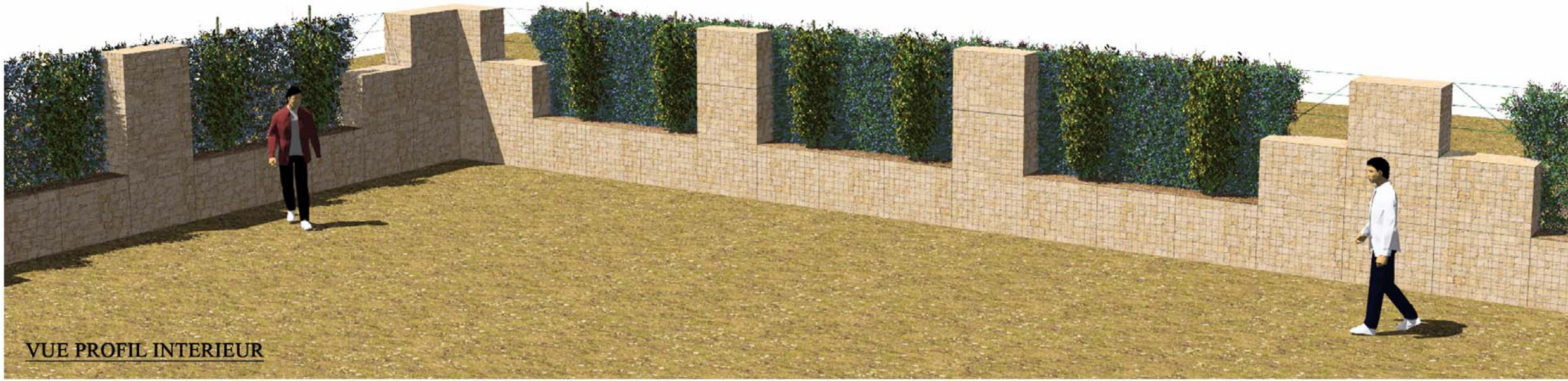
VUE PROFIL INTERIEUR