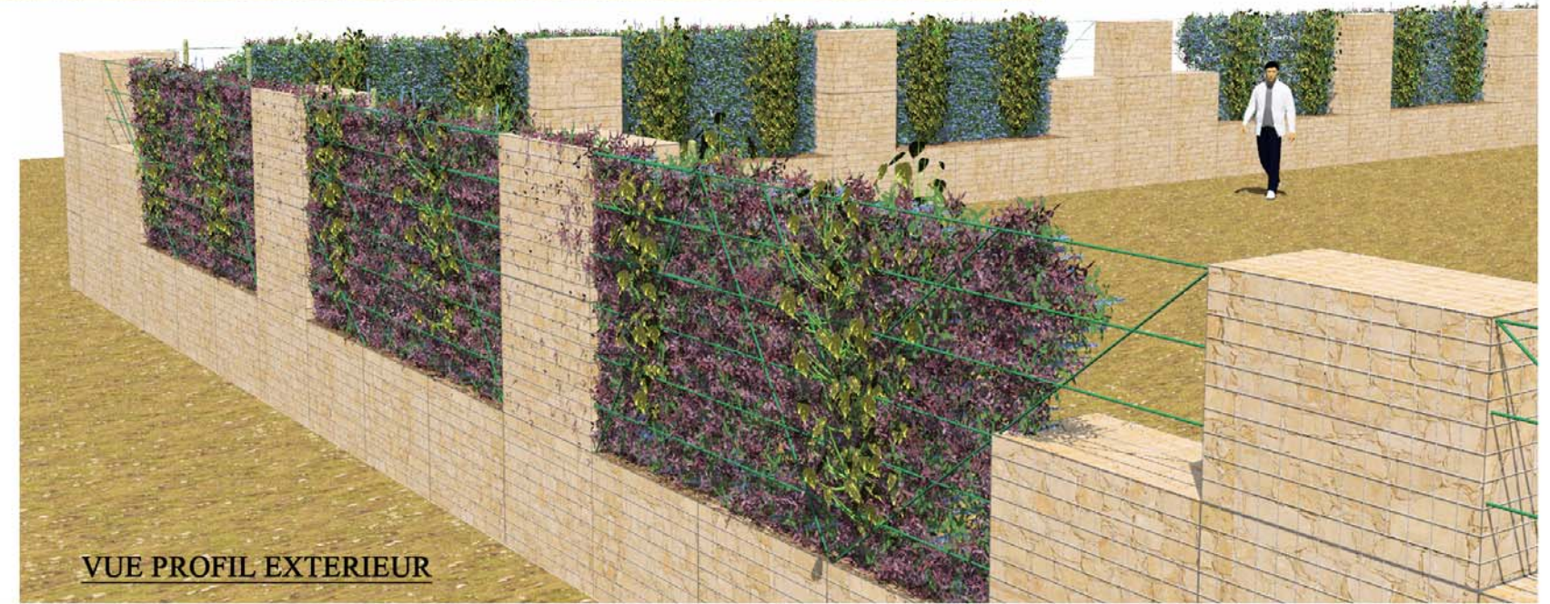
VUE PROFIL EXTERIEUR