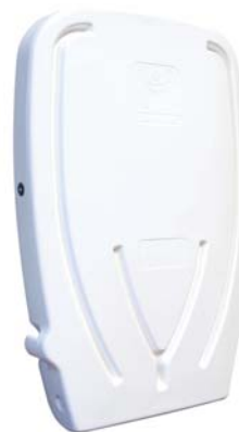
Modèle vertical Ref. A131