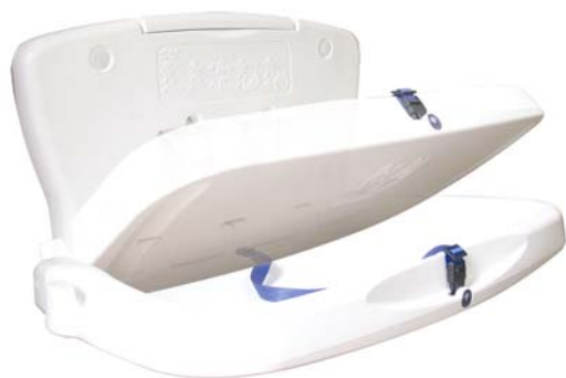
Modèle horizontal Ref. A130