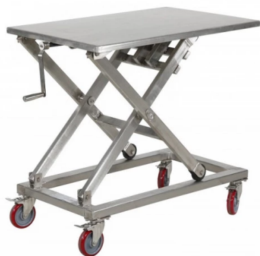
Table de levage manuel en inox 304 - Charge 300 kg