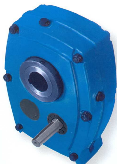
Réducteurs pendulaires (SMSR's)

Plus de 30 ans de références au service de l'industrie.