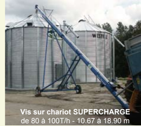
Vis sur chariot SUPERCHARGE de 80 à 100T/h - 10.67 à 18.90 m