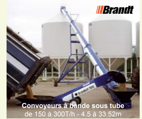
Convoyeurs à bande sous tube de 150 à 300T/h - 4.5 à 33.52m