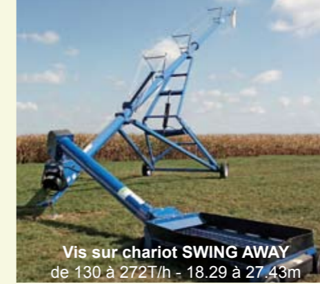
Vis sur chariot SWING AWAY de 130 à 272T/h - 18.29 à 27.43m