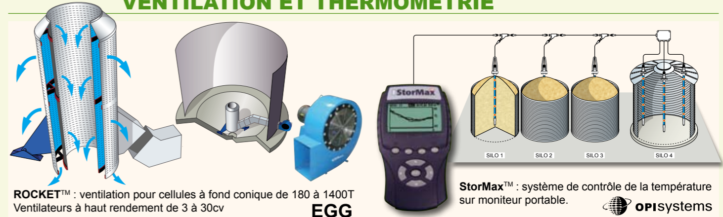
ROCKET™ : ventilation pour cellules à fond conique de 180 à 1400T Ventilateurs à haut rendement de 3 à 30cv