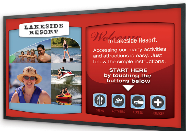
Les modèles de la série EP et PS de Planar sont disponibles en version tactile.

Les séries EP et PS de Planar peuvent être tactilisées. Cette vitre est assemblée en usine et protège efficacement l'écran contre la poussière, l'humidité et la moisissure. La solution de Planar offre un « dual touch » précis ainsi qu'une protection physique accrue pour les environnements grands publics.