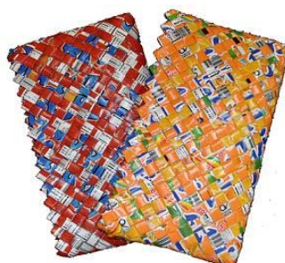
Portefeuille 2 22cm x 12cm