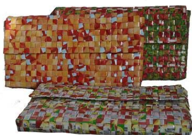
Pochette grande 34cm x 15 cm