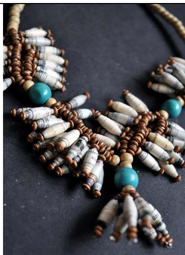
PNA 09 -11