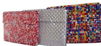
HS003 Pochette laptop