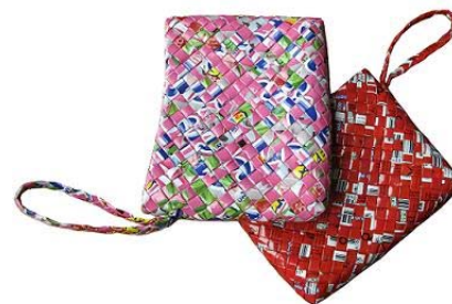
Trousse de maquillage