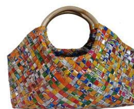
WV10-05-2A Sac à main avec des hanches en bambou Motifs colorés