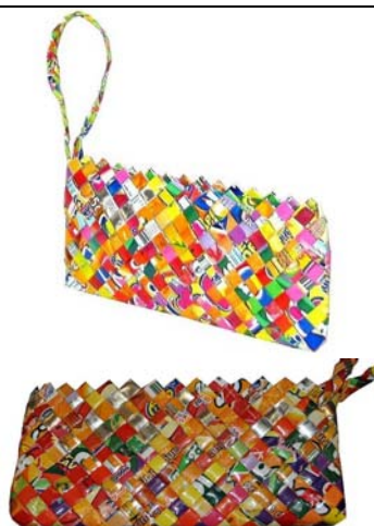
Portefeuille 1 23cm x 11cm