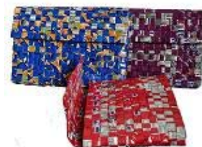
Pochette petite 27cm x 15 cm