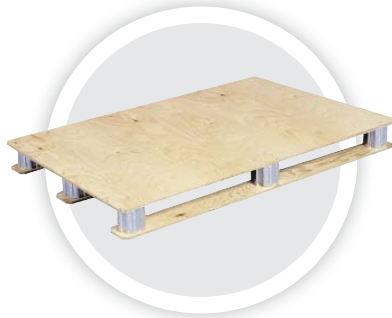
Palette contreplaquée (Can Pallet)