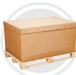
Conteneur carton sur palette