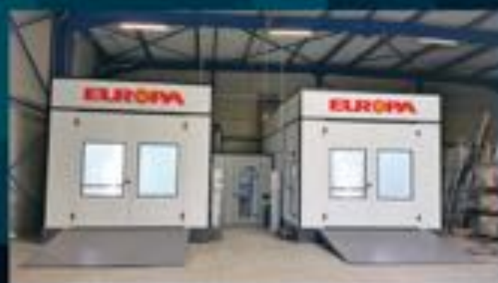
Cabines sur soubassements rampes extérieures ou pneumatiques

Un outil clé de votre Retour sur Investissement