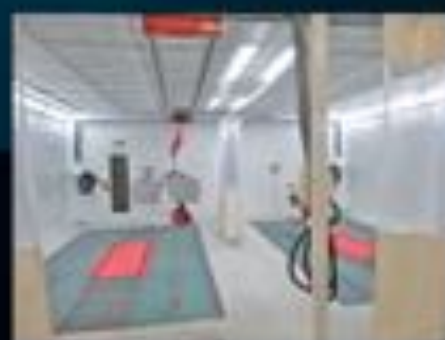
Aire double de préparation compensée