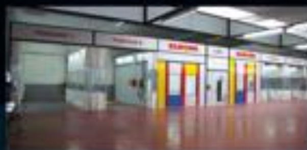
Ligne concept cabines labo-ponçage-préparation