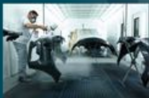
Application simultanée sur ligne double pièces et VL