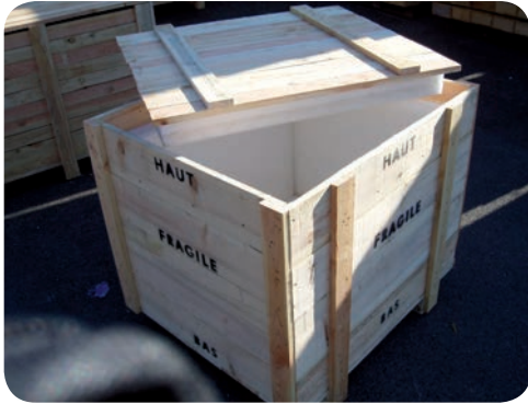
Caisse carton ou caisse wrap.