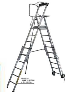
Travail en hauteur Armoire vestiaire 2C2A (08)