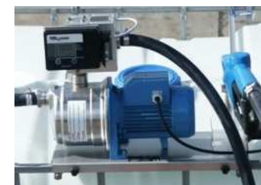
Pompes Adblue Flottes / Transporteurs