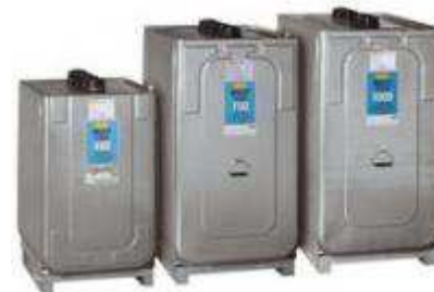
Cuves à fuel / Cuves à huile Défense (Thélus) 62 Ville de Calais, 2C2A (08)