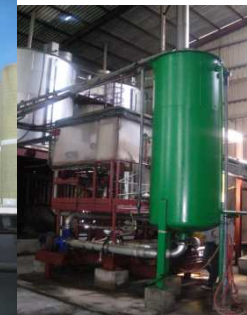
Maintenance et transformation de réseaux et procédés de fabrication