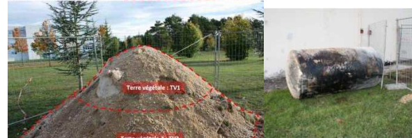
Mise aux normes, démantèlement et dépollution – Mourmelon le Grand (51)