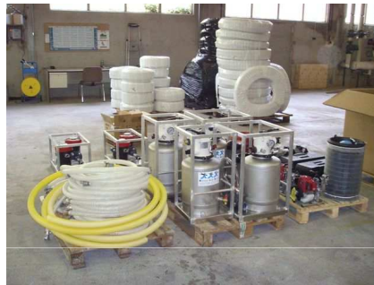
Station de production d'eau potable 2m 3 /h spécialement étudiée pour la Sécurité Civile avec un conditionnement adapté pour une ½ palette de DASH 8