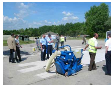
Grenailleuse - 25RGA