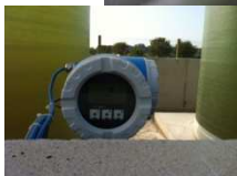
TOPAZ EVOLUTION Système automatisé de distribution de solutions azotées

Libre Service sans pesée De nombreuses coopératives nous font déjà confiance !