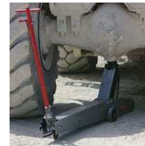
SIMMT (78) Matériels de levage