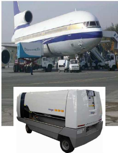
Groupes électrogènes de piste GPU 400 Hz – 100 KVA au profit de l'Aéroport Tadjik Air / Douchanbe – Tadjikistan Et pièces détachées