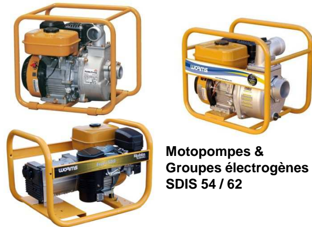
Motopompes & Groupes électrogènes SDIS 54 / 62