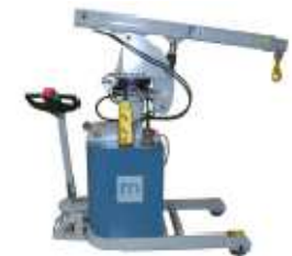
Matériel de levage et manutention électro-hydraulique