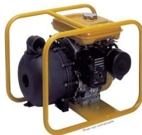
SIMMT (78) Motopompes transportables