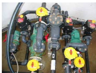
Station de saumure – pompes et concentration SANEF Jarny (54)