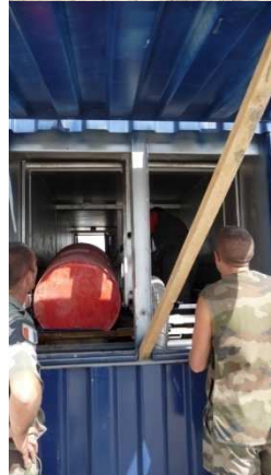
DETAIR Génie de l'Air Douchanbe Tadjikistan