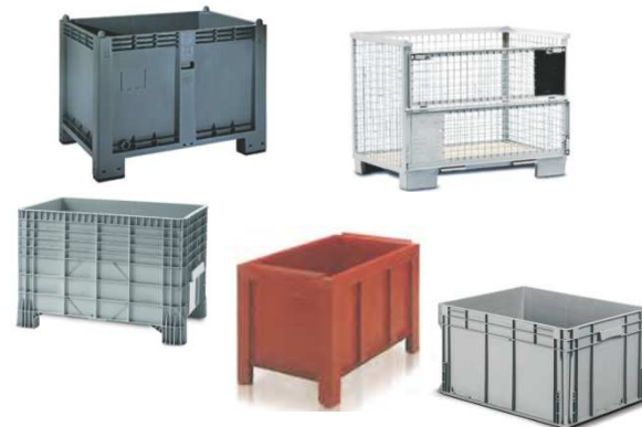
Caisses de stockage / Cantines SDIS 02 / 38 / 41 / 46 / 73 / 74