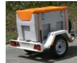
Remorques à carburant Conseil Général 87