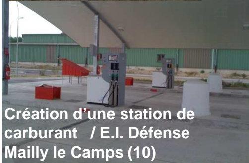
Création d'une station de carburant / E.I. Défense Mailly le Camps (10)