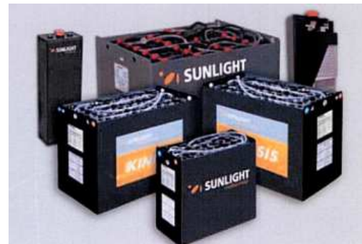
25 RGA (13) Bacs à batteries