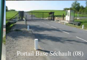
Installation de contrôles d'accès