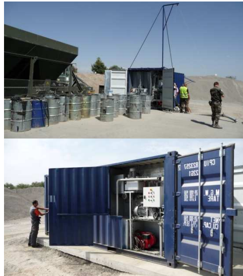
Réchauffage Pompage de bitume