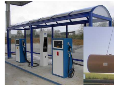
Création et réalisation de vos stations de distribution de carburant Gestion automatisée et centralisée