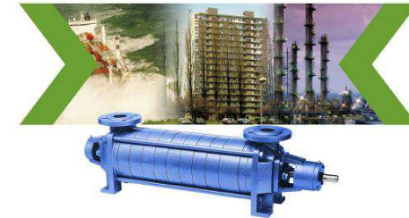
Pompe centrifuge auto amorçante Service des Essences des armées Pour l'Afghanistan