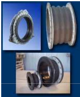
Compensateurs de dilatation & housses anti-feu Marine Nationale – Toulon (83)