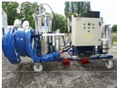
Machine à joint bicomposite étudiée pour le Génie de l'Air