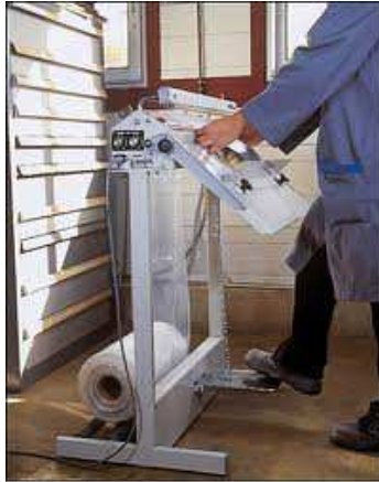
SIMMT (78) Matériels d'emballage