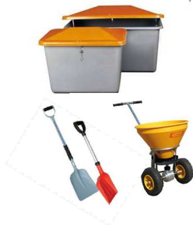
Matériel de viabilité hivernale SDIS 51 / Coeur d'Ardennes 08