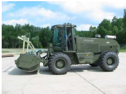
Broyeur Forestier étudié pour le Génie de l'Air