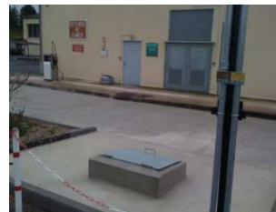
Station de distribution de carburant - Connantray (51)