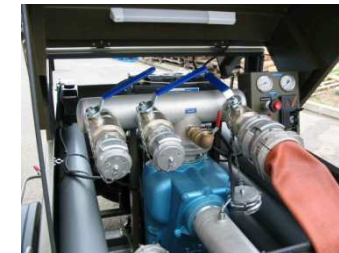
Réalisation de remorque Motopompe 120 m 3 /h pour le Génie de l'Air