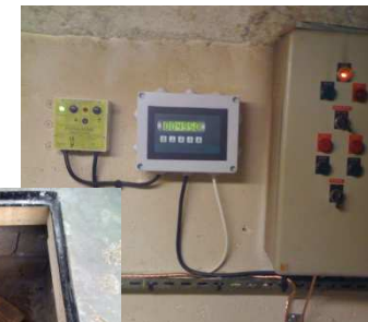
Vogelis (88) Mise aux normes cuves à fuel