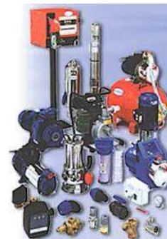
Fourniture et maintenance de pompes industrielles et domestiques