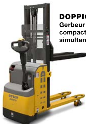
DOPPIO PSD Gerbeur accompagnant compact pour la manutention simultanée de 2 palettes

Pour le chargement/déchargement à quai, gerbage de 2 palettes à la fois et transferts sur courtes distances. Pour le chargement / déchargement de 2 palettes à la fois dans les camions à double niveau Timon déporté. Code d'accès et ordinateur de bord avec diagnostic intégré. Capacité de levage : 1250 kg / 1600 kg sur les longerons Hauteur de levage : jusqu'à 2,00 mètres