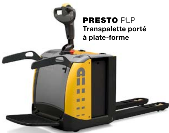
PRESTO PLP Transpalette porté à plate-forme

Pour le transfert interne et le chargement/déchargement à quai. Plate-forme et barres de protection rabattables ou plate-forme fixe avec protections latérales ou dossier arrière. Système «Friction Force» pour une traction optimale dans toutes les situations.