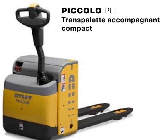
PICCOLO PLL Transpalette accompagnant compact

Pour le chargement/déchargement à quai et les transferts internes sur courtes distances.