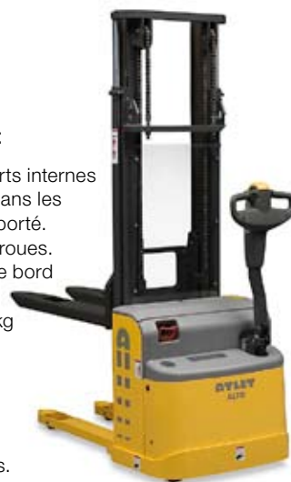
ALTO PSH Version pour applications intensives jusqu'à 4,80 mètres.