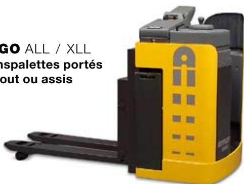
ERGO ALL / XLL Transpalettes portés debout ou assis

Pour les transferts internes longue distance lors d'opérations intensives. Visibilité excellente. Large gammes d'options et d'accessoires.