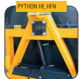
PYTHON HF, HFN