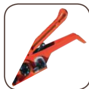
Pince de serrage pour la tension