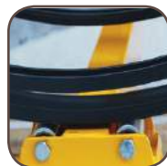
Double rouleaux de soutien