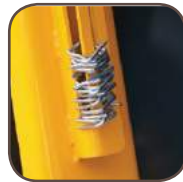
Support d'agrafes en série