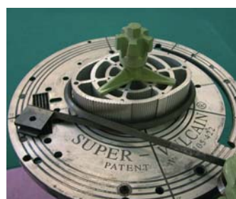
L'OUTIL DE FORME

Réalise, avec des fers plats maxi 20 x 8 et carré de 16 sur plat ou sur chant, des cercles de 100, 150 et 200. Pour chaque cercle l'outil permet de faire un œuf et un ovale.