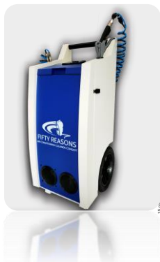
Pulvérisateur à pression d'air