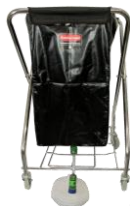
Bac de lavage