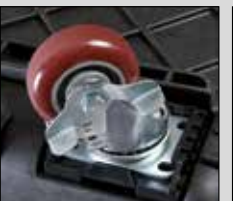
Kit de roulettes pivotantes