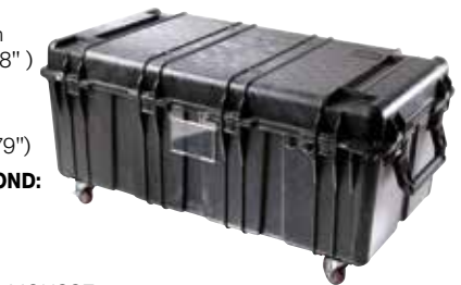
illustration avec roulettes optionnelles