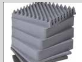
Rechange\ Mousse haute densité prédécoupée