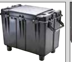
Élévateur de palettes