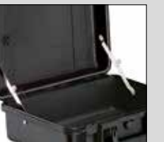
Compas de couvercle

Des plaques signalétiques et des bandoulières rembourrées aux verrous TSA et aux indicateurs d'humidité, Peli™ propose une vaste gamme d'accessoires pour valises.